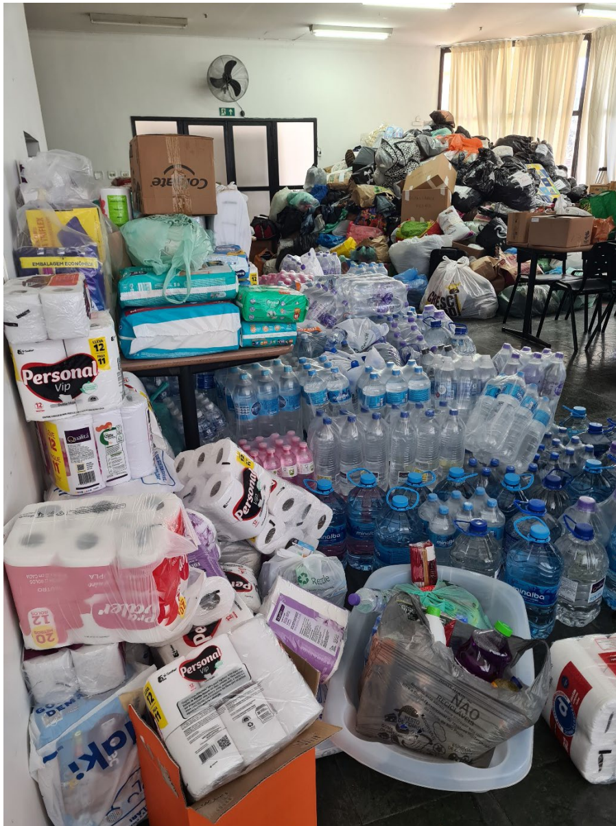
Algumas das doações do público em geral que vieram através da THQ

O Quartel Nacional (São Paulo) enviou 14 caminhões de grande porte e o único veículo de resposta a emergências do território para a área afetada.